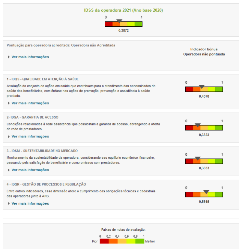
Gráfico de evolução do IDSS - TISS

A ANS iniciou, a partir do IDSS ano-base 2017, uma nova etapa do Programa de Qualificação, que usa o Sistema de Informação do Padrão TISS (Troca de Informações na Saúde Suplementar) como fonte de dados para o processamento dos indicadores. A metodologia foi totalmente modificada, com os indicadores calculados sobre uma base de dados nova, gerando resultados que não são totalmente comparáveis com os anos anteriores.